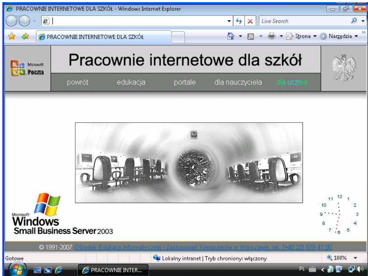
Rysunek 1 Wygląd domyślnej strony WWW w intranecie szkolnym

Sytuacja może występować przy pierwszym logowaniu do systemu na dane konto użytkownika.